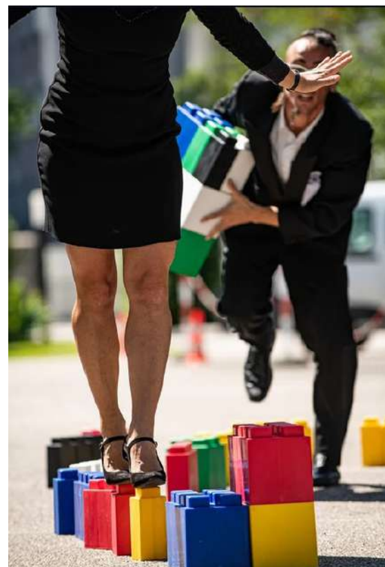
Theatro Bislacco // Totem Tango

De 21 h 30 à 23 h 30 : In illo tempore (Fr) Bal masqué - Musique et Danse