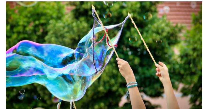
Ateliers Bulles de savon géantes

15 h 30 : Andrea Brugnera "Tristan et Isolde" (It) Théâtre (Rue du Clape en Bas)