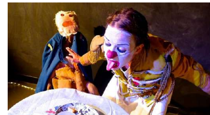
Cie Hors de l'eau // Kittiwake

SUR LA PLACE DU GENERAL DE GAULLE // CENTRE VILLE