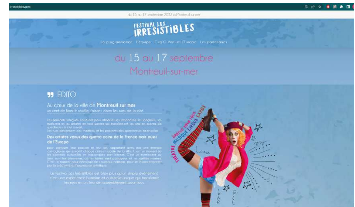
Site internet en construction réalisé par Thinkforweb