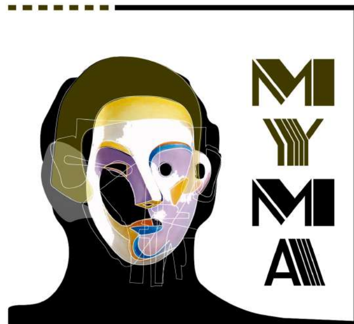
Logo du projet européen "Myths and masks of the future theater"

Cirq'O Vent c'est la prouesse de l'équilibre entre les créations artistiques diffusées au delà des Hauts de France, berceau de la compagnie, la pédagogie artistique déployée sur tout le territoire, et le lieu que nous développons à Lespinoy, dans le Pas-de-Calais.