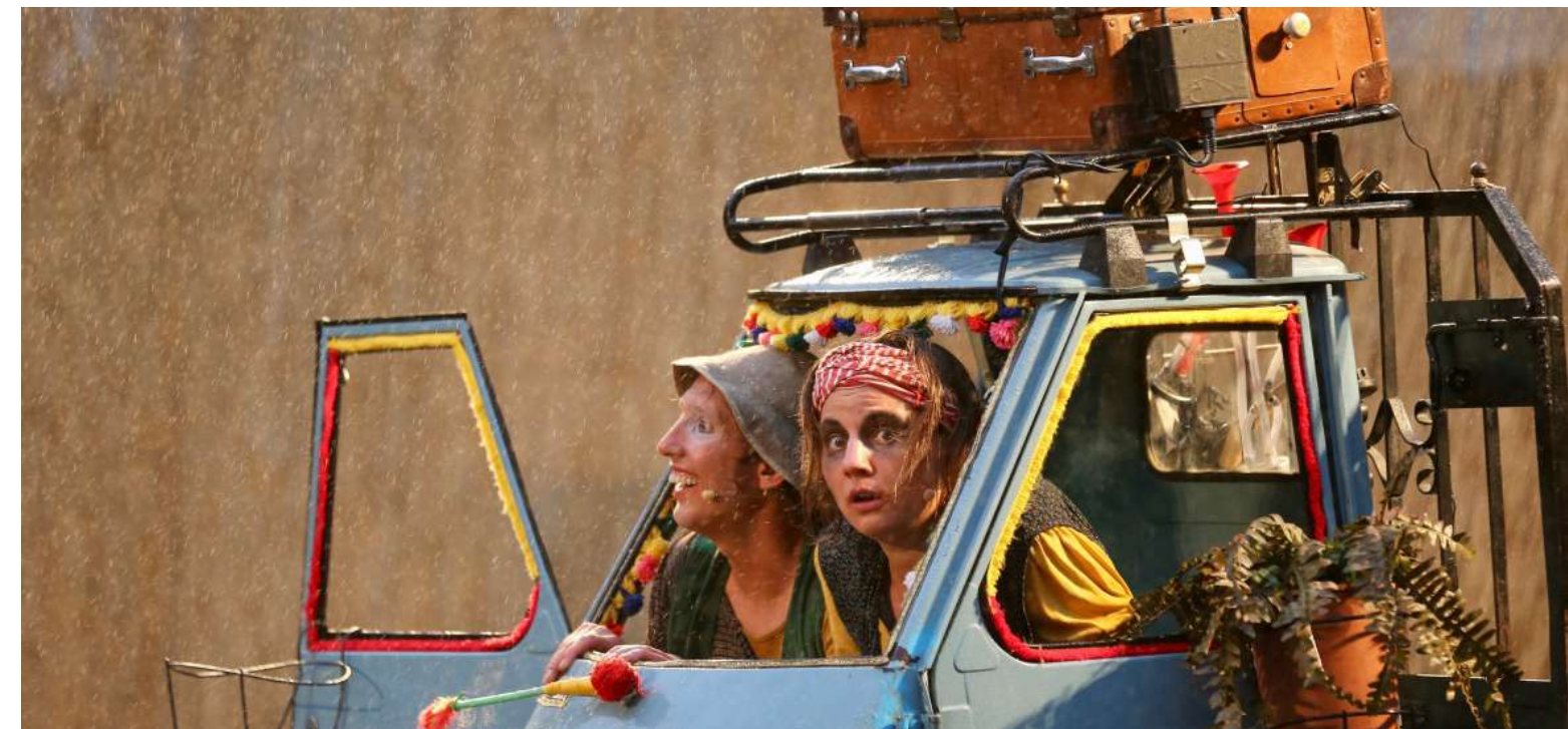
Cie Fada // Miracle