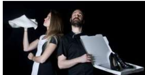
Cie Part 2 rien // Gluten Rhapsody

Soirée de convivialité entre les partenaires, suivie de spectacles de lancement